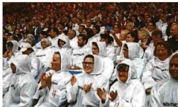
Die Premiere auf der Walensee-Bühne: Trotz des Regens waren die Zuschauer von den Darstellern begeistert.